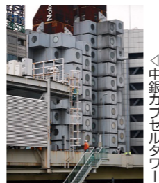
中銀カプセルタワー